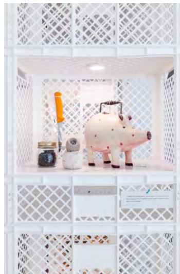
Impressionen aus der Ausstellung